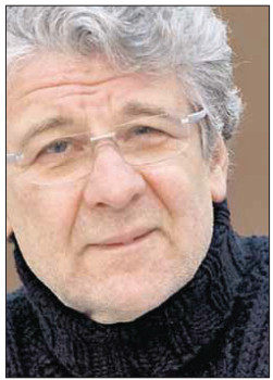
„Grundsätzlich integrationswütig“: Sportmoderator Marcel Reif (li.)

Caroline Peters ist vor ein paar Stunden erst aus Deutschland in Wien angekommen, das heißt, sie ist in Wahrheit nicht angekommen hier in Wien, wo sie seit mehr als zehn Jahren Burghauspielerin ist, aber im täglichen Leben fremd. Wie eine Figur von Beckett. Im deutschen Fernsehen spielt sie die Sophie Haas in der Serie „Mord mit Aussicht“, die im kommenden Jahr fortgesetzt wird – eine Kommissarin aus Köln, die in der Provinz nicht zurande kommt. Peters wirkt immer noch fassungslos, so jedenfalls sitzt sie im Café des Hotels Imperial am Kärrntner Ring. „Ich war im ganzen Leben noch nie so deutsch wie hier.“