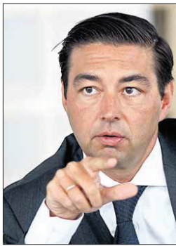
„Dann noch einen schönen Aufenthalt in Wien!“: das hört er setzt zwanzig Jahren.

eigentlich Schauspieler und Fotograf ist wie in Berlin und einem lustlos das Essen auf den Tisch knallt, das – nebenbei – in Wien nicht so sagenhaft schlecht ist wie in der deutschen Hauptstadt. Und dass der ältere Herr am Nebentisch im Imperial im grauen Anzug dasitzt und das Szegediner Gulasch mit Bedacht zum Mund führt, behagt ihr auch: „In Deutschland hätte der vermutlich was Lockeres an.“